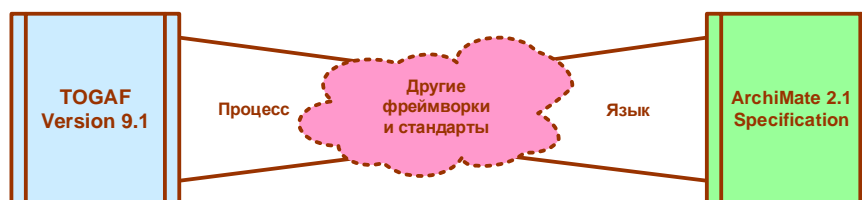
Рис. 1-1. Независимое использование TOGAF и ArchiMate

С одной стороны, у TOGAF и ArchiMate имеются свои спецификации, и они могут использоваться по отдельности, независимо друг от друга, или совместно с другими стандартами и фреймворками (Рис. 1-1):